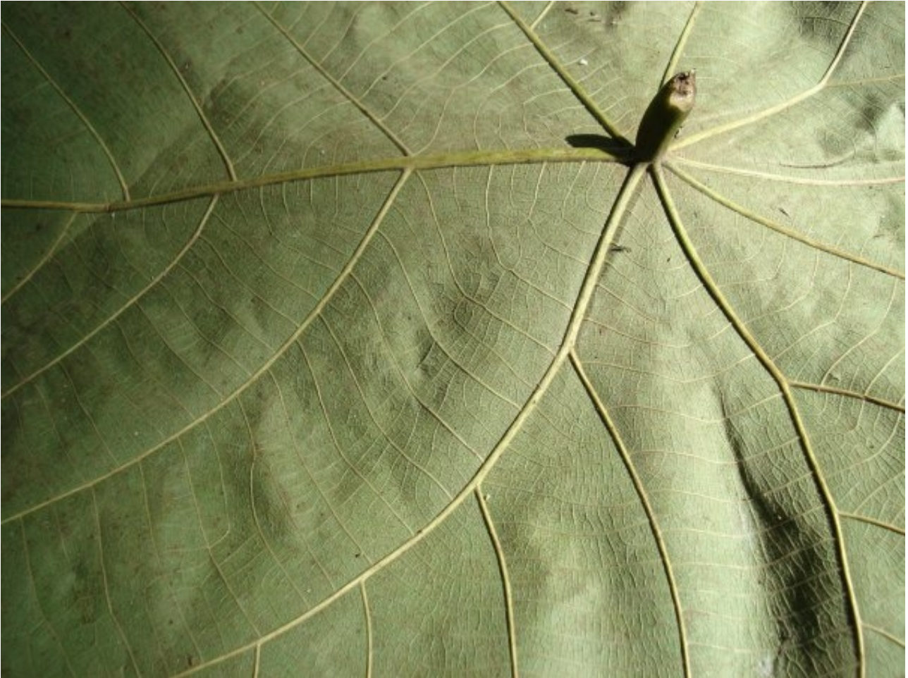
espiral da sensibilidade e do conhecimento um projeto de euler sandeville

conheça o projeto a natureza e o tempo (o mundo)