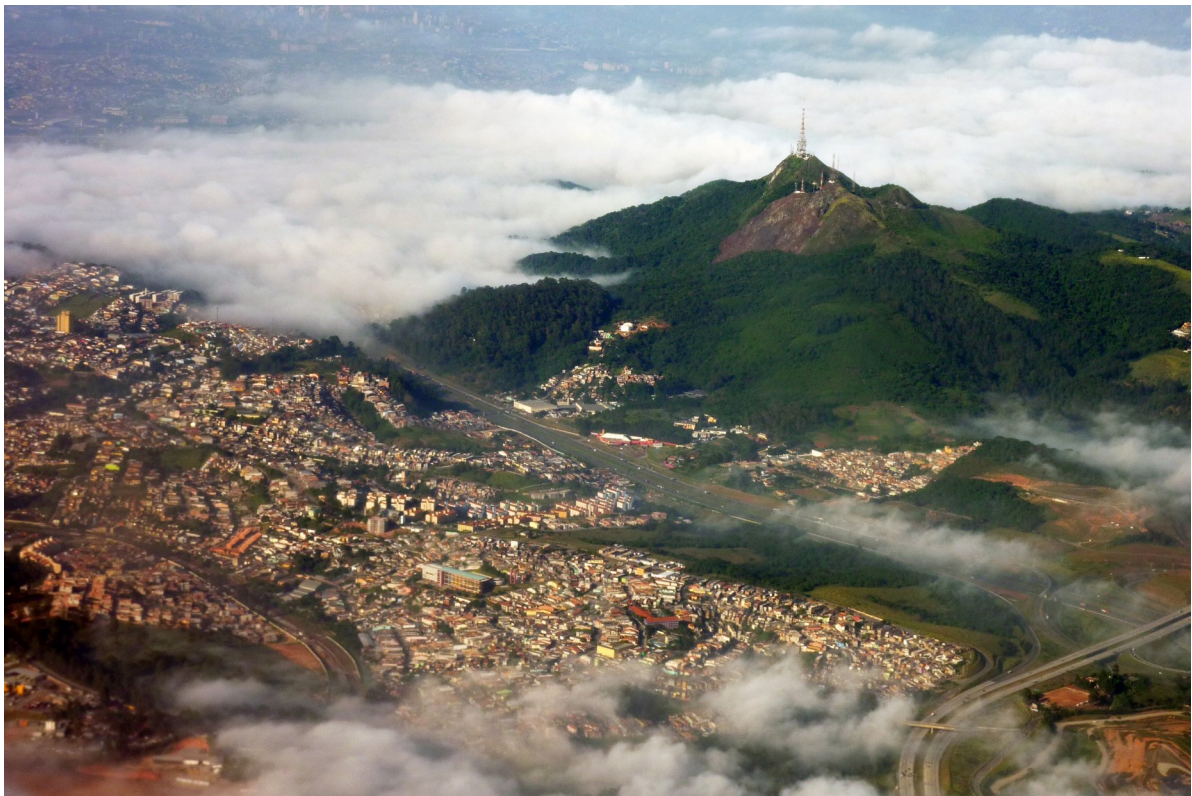
Imagem da área de estudo e intervenção

Parque Estadual do Jaraguá e Terra Indígena do Jaraguá, São Paulo, SP